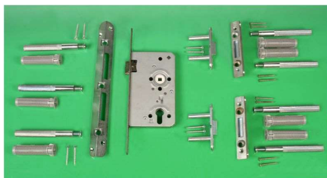
Beispiel eines (Tür-)Nachrüstsatzes für Holztüren

Auch Türen können mit einem Sicherungssystem im Falz nachgerüstet werden. Zusätzlich ist ein einbruchhemmender Schutz-beschlag und Profilzylinder erforderlich.